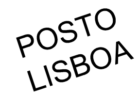
RUA IBRAHIM ALVES DE CASTRO